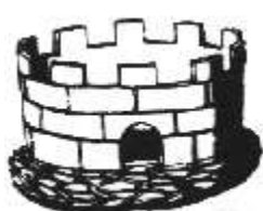
а) римские венцы