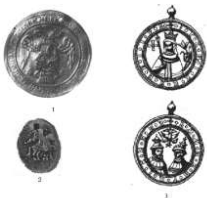
1. Золотый для награждения воевод гродзких XVII в.; 2. Золотый для награждения дворянского сословия гродзких XVII в.; 3. Наградная медаль царевны Софьи